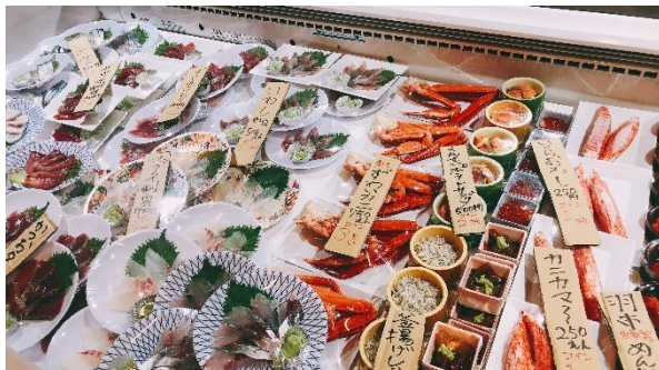
壮観のショーケース

美味しい魚を楽しんで味わってほしいと思い、店内には様々な仕掛けを用意。昔ながらの魚屋の雰囲気あふれる店頭では巨大水槽で鮮魚が泳ぎます。壮観の店内ショーケースでは調理したばかりの鮮魚が並び、お客様は好きなものを自分で選ぶことができます。1皿1皿パックした魚を自分の手で取ること衛生的にも安心です。カニやワカメはダシがたっぷり出た店内の黒鍋でその場で茹でて食べることもできます。また、店内では羽市コインを利用。お客様はコインを購入し、商品と交換します。