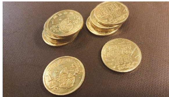
羽市コインを購入し商品と交換